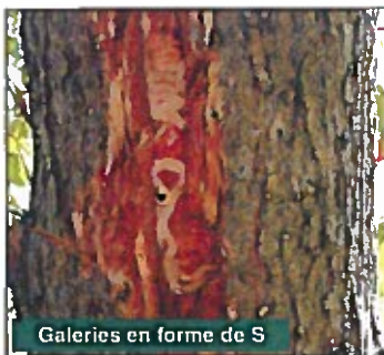
Galeries en forme de S

Si vous observez des signes suspects d'infestation sur vos frênes ou si vous prévoyez transporter du bois de chauffage (p. ex., lors d'une excursion de camping, d'un déménagement ou de l'aménagement d'un boisé), communiquez avec l'Agence canadienne d'inspection des aliments (ACIA) pour obtenir de plus amples renseignements.