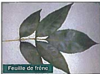
Feuille de frêne